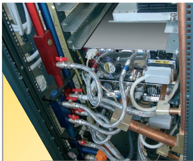
→ Liquid cooling system view

La ridondanza costruttiva degli amplificatori, l'impianto di raffreddamento con circuito del liquido a bassa pressione e i tubi del circuito